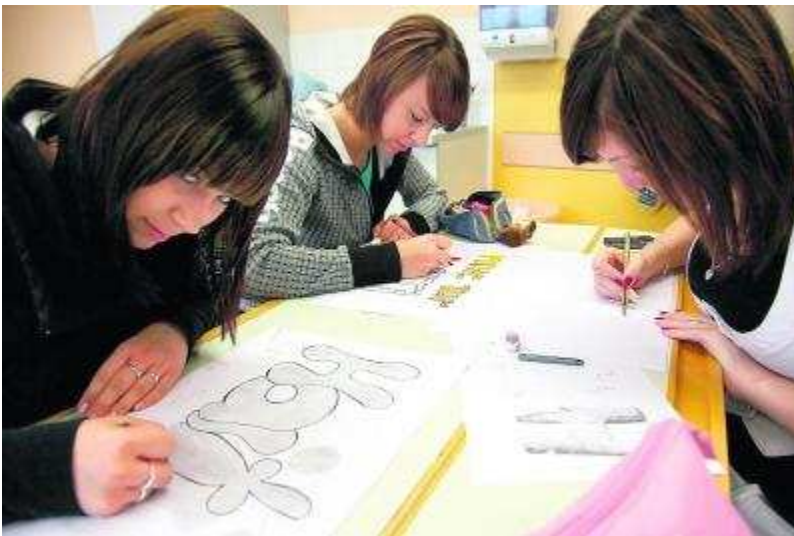
In den älteren Klassen der Staatlichen Regelschule werden die Plakate und Einladungen gestaltet.

Schmalkalden - Über Wochen hinweg bestimmte das verheerende Erdbeben auf Haiti die Schlagzeilen und Nachrichtensendungen. Am 12. Januar waren Hunderttausende Kinder, Frauen und Männer ums Leben gekommen, weitere Hunderttausende verletzt worden. Ein Land, das zu den ärmsten der Welt gehört, lag in Trümmern. Umgehend rollte eine Welle der Hilfsbereitschaft an. So hat beispielsweise die "Aktion Deutschland Hilft" gemeinsam mit seinen Mitgliedsorganisationen in den vergangenen drei Monaten 31,5 Millionen Euro an Spenden gesammelt. Diese kommen nun über mehrere Jahre Hilfsprojekten in Haiti zugute. Sie sollen neben einer Grundversorgung der Menschen zu einer Stabilisierung der Gesellschaft beitragen.